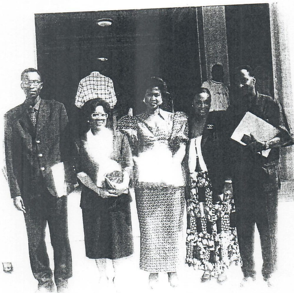
De gauche à droite, la Représentante du Conseil Economique et Social, le Représentant du Ministre de l'Economie, des Finances, Chargé du Plan, Mme le Représentant Résident du PNUD/DAKAR, la Chargée de Programme RAF/95/009 au PNUD/DAKAR, la Chargée de Programme de la Coordination Régionale, le Coordonnateur Régional.