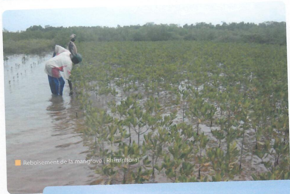
■ Reboisement de la mangrove (Rhizophora)