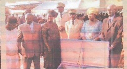
Cérémonie de lancement du projet PMF/FEM Cuisinières solaires de Mékhé par M le Ministre de la Recherche Scientifique, des Biocarburants et des Energies Renouvelables