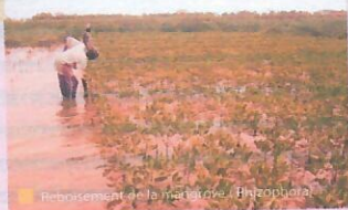
Reboisement de la mangrove (Iphigenia)