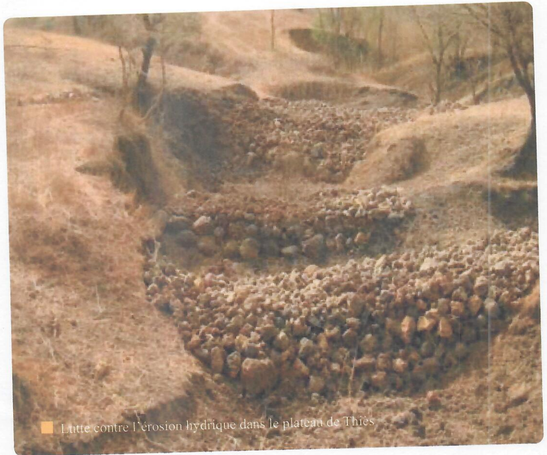
■ Lutte contre l'érosion hydrique dans le plateau de Thiès