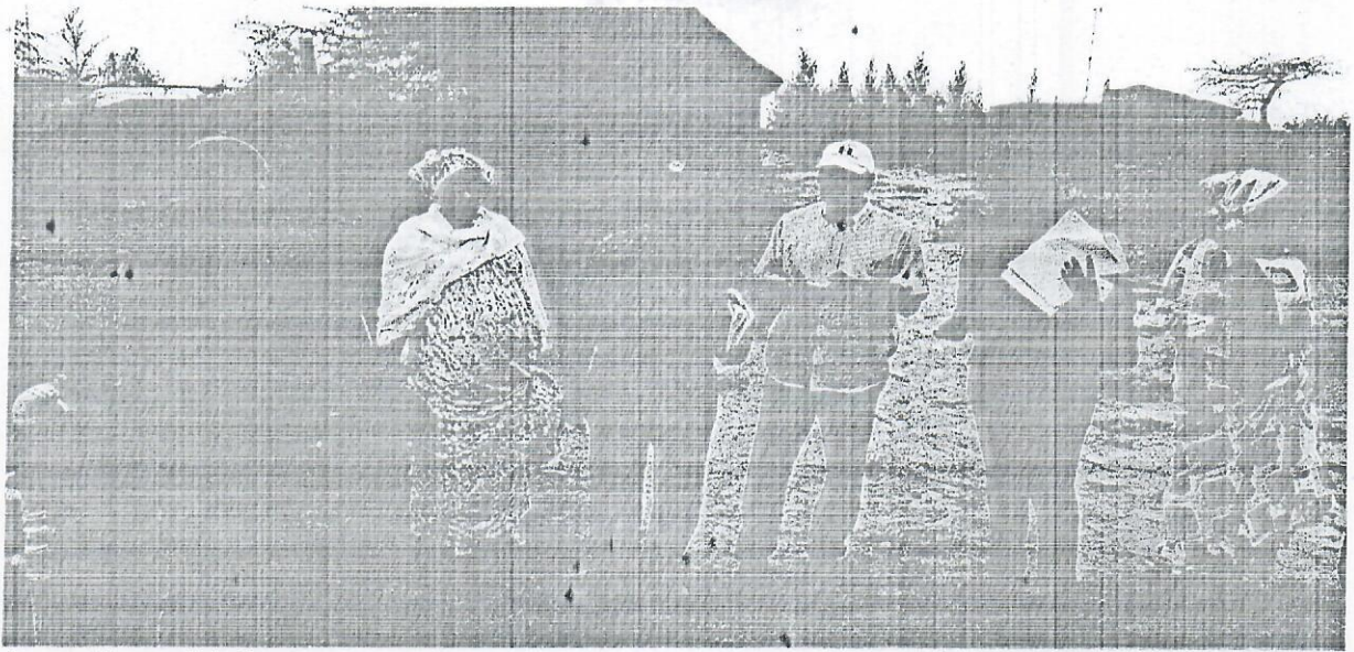
Centre d'accueil de l'ONG village Pilote – Lac Rose