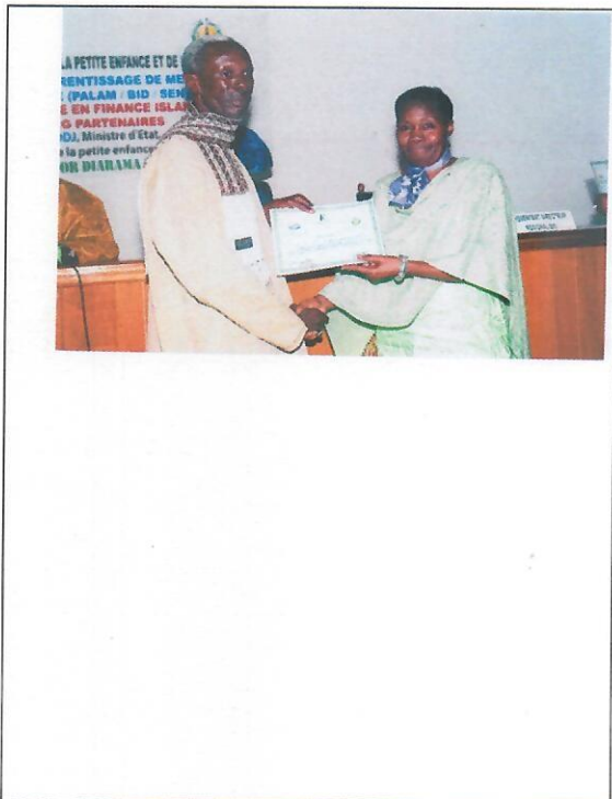
Mme Maïga de la BID remettant une attestation