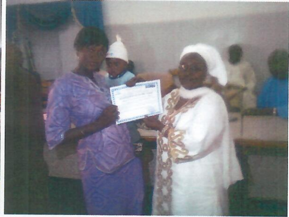
Mme la Directrice du PALAM remettant une attestation à une volontaire