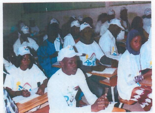
Les volontaires du PALAM en formation au CRFPE de Diourbel