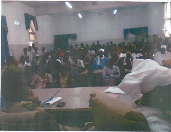
Cérémonie de remise attestations de fin de formation sous la présidence du Gouverneur de Diourbel