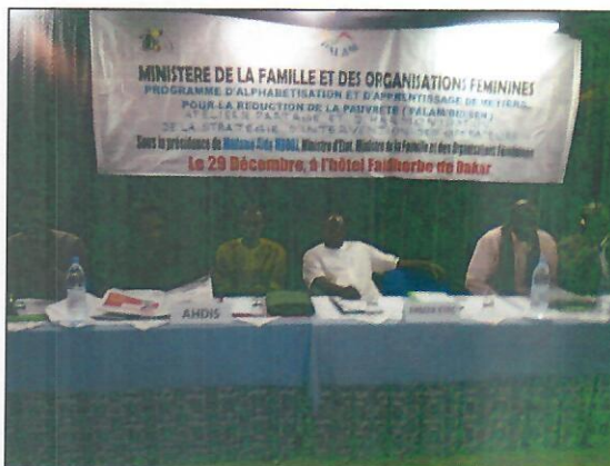
Vue de la salle des participants à l'atelier