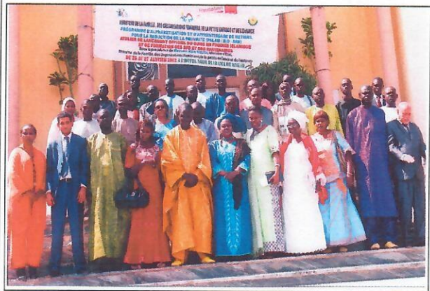
Photo de famille des participants à l'atelier