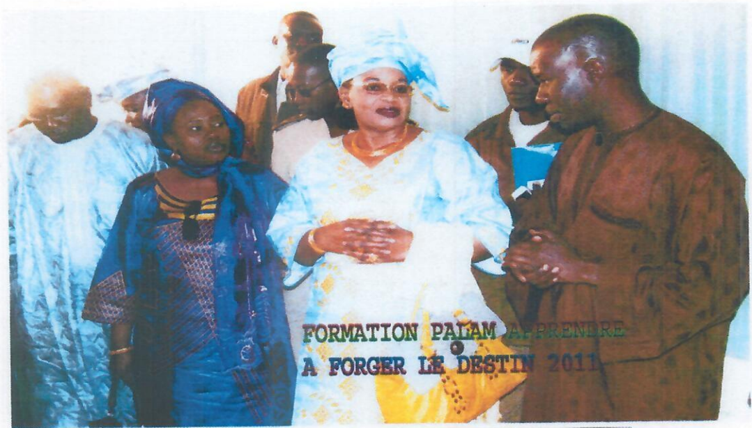
Madame le Ministre d'Etat en compagnie de Madame la Directrice du PALAM et du Directeur du CRFPE visitant les volontaires du PALAM en formation