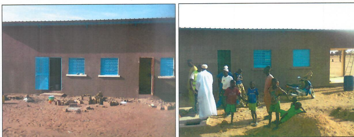
Salles de classe ECB en finition dans la région de Diourbel